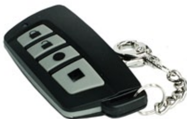
TR-4H – pilot do RF-4