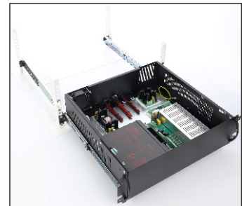
Montaż na szynie ARAS600N/800N/1000N