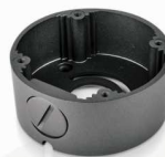
Pierścień mocujący EVX-C-B14