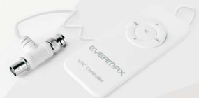
Kontroler zdalnego sterowania EVX-UTC-CR1