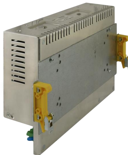
Rys. 2. Przykład montażu zasilacza.