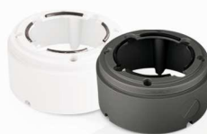
Pierścień mocujący EVX-CD-B1