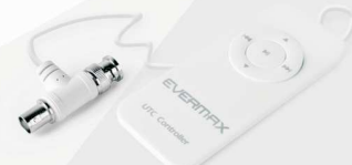
Kontroler zdalnego sterowania EVX-UTC-CR1